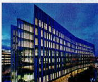
Le projet le plus conséquent : la tour 1 à La Défense.