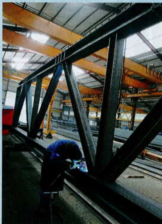
Le plus gros chantier du moment est le futur centre des congrès de Nancy, à côté de la gare, « un marché d'environ 3 millions d'euros et 800 tonnes de charpente ».