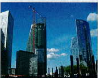
L'entreprise a réalisé un immeuble de bureaux pour Bouygues Immobilier en région parisienne.

SALARIÉS : EFFECTIFS RÉPARTIS SUR DEUX SITES VOSGIENS, DINOZÉ ET RAMBERVILLERS.